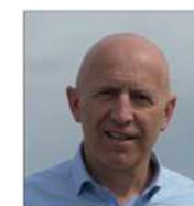
Dominique POTIER Agriculteur et député de Meurthe-et-Moselle