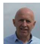
Dominique POTIER Agriculteur et député de Meurthe-et-Moselle